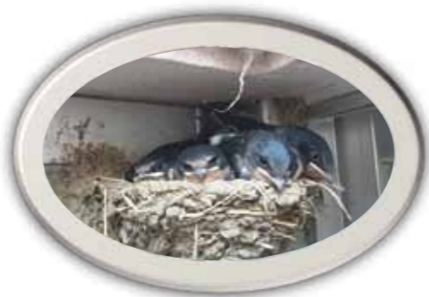
毎年来るかわいいお客様！