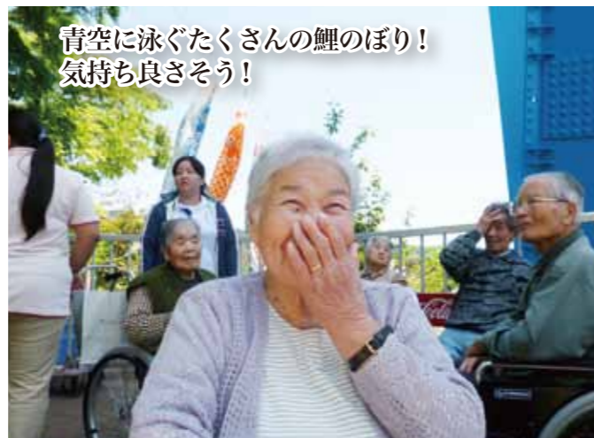
青空に泳ぐたくさんの鯉のぼり！ 気持ち良さそう！