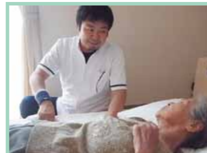
心と体をほぐす「リハビリ」 を行っています。