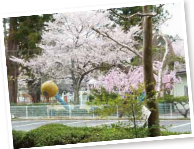
私たちは、花見は桜餅で！ 花よりだんごかな？