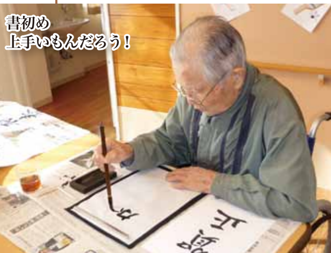
書初め 上手いもんだらう！

一年目の笑顔！ 施設を利用される皆様の笑顔が介護する私たちの心の励みとなっております。笑顔がいつばいの施設を目指し、利用者様と共に毎日を過ごしてまいります。