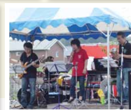
◀ ノーツ オブ ブルーエナジーの皆様